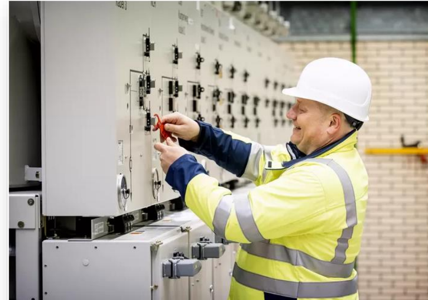
▲ Een verdeelstation van netwerkbedrijf Alliander.